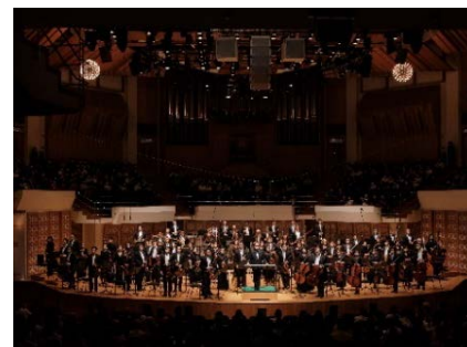
香港管弦樂團