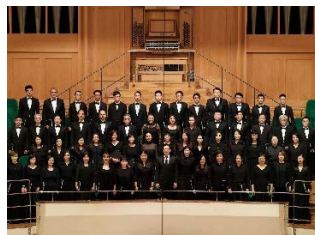
香港管弦樂團合唱團