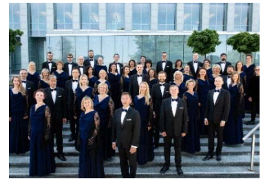
State Choir Latvia